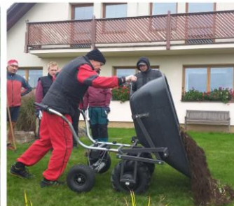
Motúčko Koňačka - hlína 300 kg