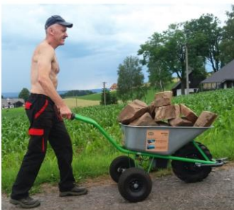
Motúčko Klasik - kameny 150 kg