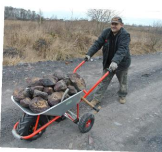
Motúčko Power: převoz 160 kg kamení po polní cestě na stavbu

Motúčko Klasik: svoz objemné a těžké úrody cca 105 kg ze zahrádky