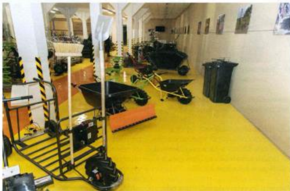
» Motúčko má spoustu různých podob.

S trochou nadsázky by se dalo říct, že jste se s Motúčkem stali průkopníky elektromobility v Česku.