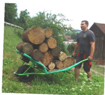
Mokař velký: s nákladem 150 kg metrového dřeva ve svahu s převýšením 70%

Tahač přívěsů a letadel: s vlekem o váze 300 kg a nákladem 1 750 kg