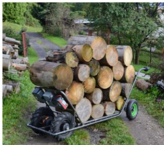
Motúčko Jumbo Double - náklad 400 kg